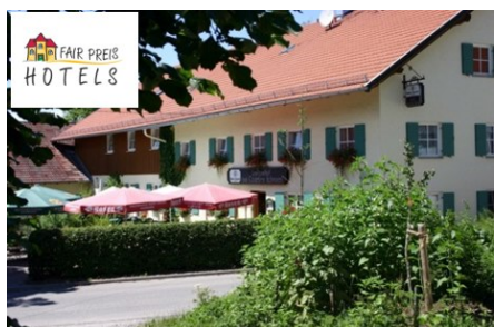
Hotel Zum Goldenen Schwanen

sind familiengeführte Hotels in Deutschland und Europa. Der Standard unserer Häuser liegt im 2 - 4 Sterne Niveau. Wir bieten unseren Gästen Wohlfühlqualität durch persönliche, freundliche Atmosphäre. Die Wünsche unserer Gäste liegen uns und unseren Mitarbeitern besonders am Herzen.